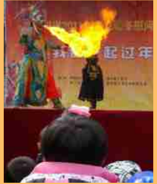
大年初五,四川省2011年文化暖冬慰问活动 上的吐火表演

春节,阖家团圆的日子。各地党委、政府为给乡亲增添节日氛围,组织开展一系列文化活动,精彩纷呈的节目,让当地市民品尝了一道道文化大餐,开心、欢笑、幸福成为市民的流行语。