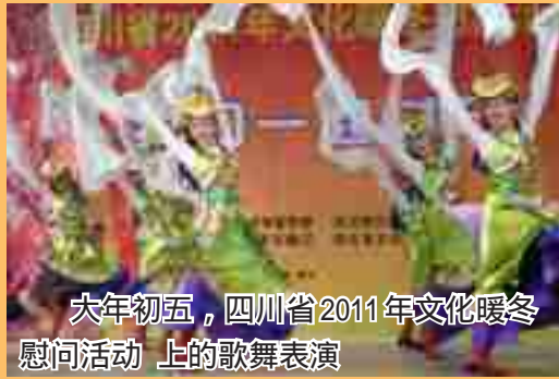
大年初五,四川省2011年文化暖冬慰问活动 上的歌舞表演