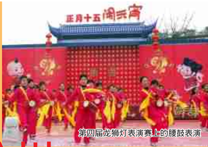
第四届龙狮灯表演赛上的腰鼓表演