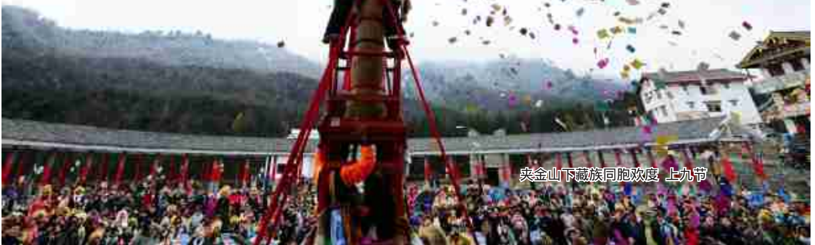
夹金山下藏族同胞欢度 上九节