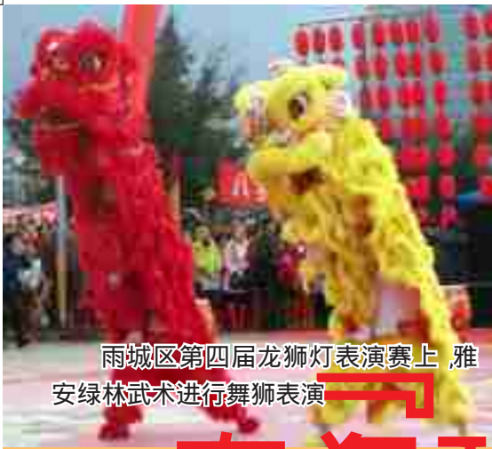
雨城区第四届龙狮灯表演赛上 雅安绿林武术进行舞狮表演