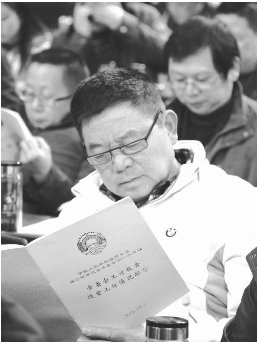
政协委员仔细听汇报