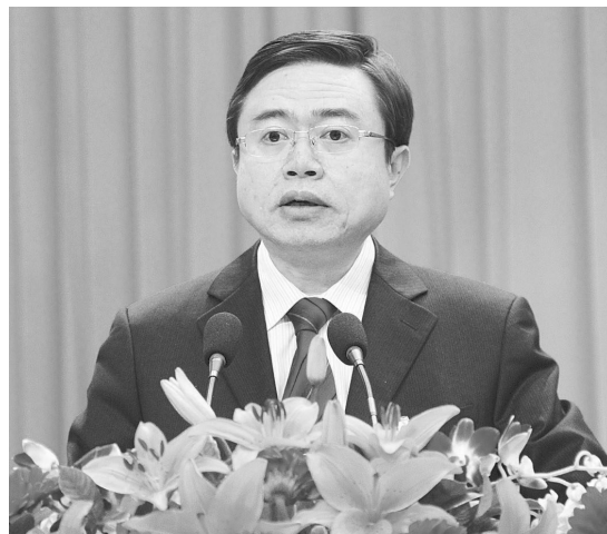
陈越良作政府工作报告

在开启国际化区域性生态城市建设,共创雅安发展新辉煌的重要时刻,备受150多万人民期盼的雅安市第三届人民代表大会第一次会议于1月31日上午在市体育馆隆重开幕。