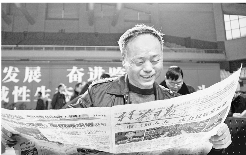
人大代表关注两会报道